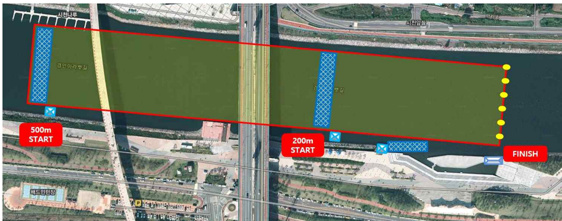
- 2,000m Round Course -